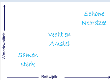
Afbeelding: Het Dagelijks Bestuur na een discussie met het Algemeen Bestuur over gewenste ambities tijdens het werkbezoek aan Berlijn op 12 mei 2017 (links), drie ambitieniveaus (rechts)